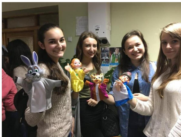
Навчальні заняття для волонтерів

ДОПОКИ ЛЮДИНА ВІДЧУВАЄ БІЛЬ – ВОНА ЖИВА. ДОПОКИ ЛЮДИНА ВІДЧУВАЄ ЧУЖИЙ БІЛЬ – ВОНА ЛЮДИНА