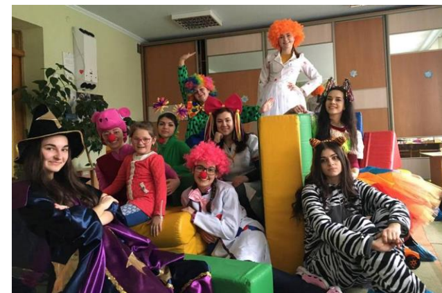
Лікарі Свято передають подарунки дітям від Святого Миколая